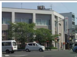
三菱東京UFJ銀行 徒歩11分