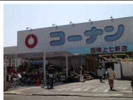
日曜大工「コーナン」 徒歩10分