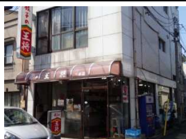
餃子の王将 徒歩3分