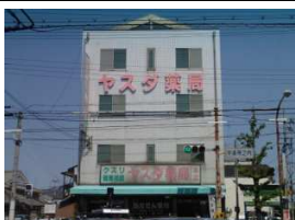
ヤスダ薬局 徒歩4分