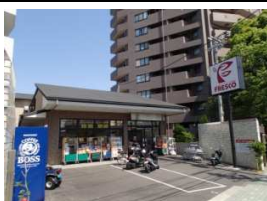
スーパー「フレスコ」 徒歩4分