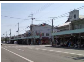
千本通り商店街 徒歩4分